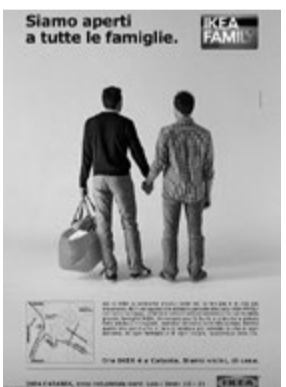
イタリアでのキャンペーン広告。

CMを流した。1994年のことである。Ikea gay adというキーワードを入れてYouTube検索すれば出てくるので興味のある方はググられたし。当時まだHIVは「絶望の病」であり、英国のゲイたちはどうせ普通の人たちみたいに長生きできないんだから」と考えていた。そんな理が本来の享乐的な性質を助長し、利他的な消費活動を生んだ。それが同性愛者のマーケティングの隆盛を導いた大きな原因のひとつである。また同時に「うせ日陰扱いなんだから確かなバックグラウンドが欲しい」という危機感がハウスハンティングを急がせ、それがゲイたちの平均よりも早い不動産獲得に繋がった。