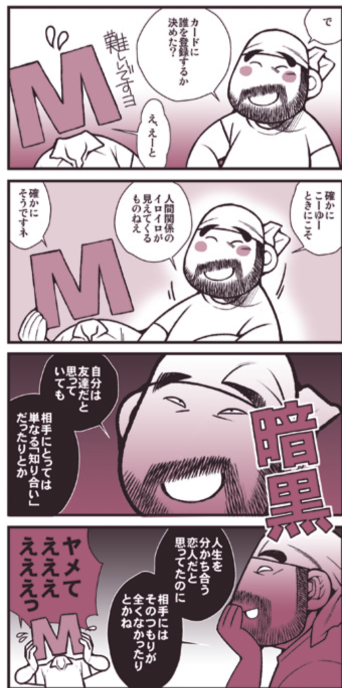
*ご本人とは全く関係ありません。 by Kazuhide Ichikawa