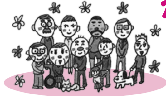
パープル・ハンズwebより。画:キヤミー

中年に至れば、健康診断のたびに、アしが高い、コレが高いと、医者にいろいろ指摘され、薬を飲むことも珍しくありません。老病死は人間の宿命ともいえるべきもの。無縁な人はいないでしょうが、LGBTゲイをはじめ、LGBTゲイをどう扱っていくかが、