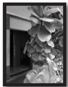
MTRチャイナタウン駅降りてすぐのハッテンサウナ「Ten Mens Club」。やる気満々の諸兄がどんどん入り口に吸い込まれて行きます。

「いや、飲むとかどうでもいいし、サウナで輝きたいの。」という諸兄。シンガポールにもそんな諸兄の舞台がございます。シンガポールのサウナと言えは「CLUB ONE SEVEN」が有名ですが、これを読んでいらっしゃる諸兄であればむしろガチムチ・熊系が集まると言われる「Ten Mens Club」がお勧め。ホームページもばっちりガチムチ仕様です。入店の仕組みはほぼ日本と同じです。ちなみにシンガポールのサウナはとて日本人にフレンドリーな所が多く、英語があまりで