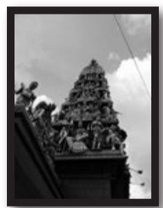
チャイナタウンのヒンズー寺院。

ンにある「マックスウェル・フードコート」。ここでは東南アジア各国の味覚がお手軽価格で楽しめます。お勧めは薄餅(ポピア)と呼ばれる春巻きのような地元料理。これがあればビールがすすむこと間違いありません。ご予算は一人様15シンガポールドル(1200円程度)もあれば充分。