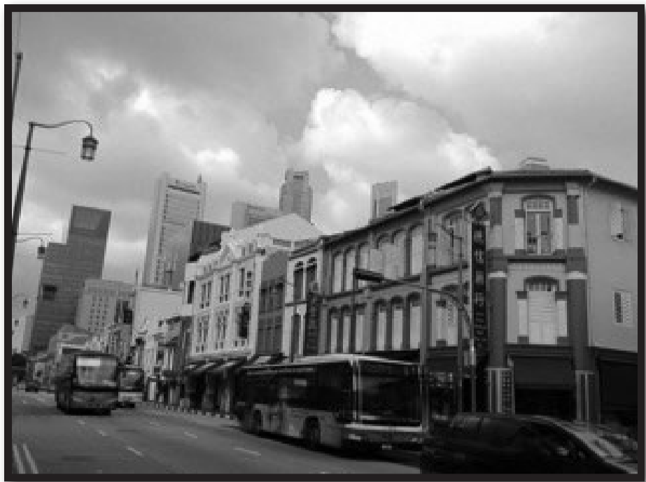
チャイナタウンのパゴダ・ストリート。高層ビルではないシンガポールの町並みはのんびり風。