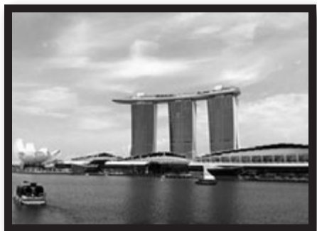
ぱっと見た所珍妙ながらも実際に入ってみると非常に美しいマリーナ・ベイ・サンズ。カジノはパスポートがあれば無料で入れます。

経済成長甚だしいとされるこの南国の空で過ごす事、はや4年。通年ではないにせよ一年のうち数カ月を過ごす私にとってはここはもはや第二の故郷でございませう。そこら中で聞こえる建設現場の騒音の中、いろんな人種に囲まれながら片言の英語で生活するのなかなか楽しいものです。表面上はクールでおしゃれな摩天楼を気取りつつその裏にはどこか昭和の匂いを残