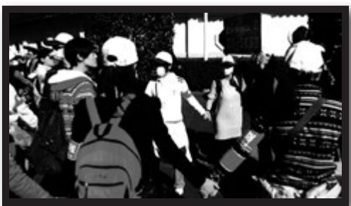
(右) 台南にあるチーカンロウ。こういった上品さが漂う歴史的建造物が台南には溢れています。(左) 同性婚法案に反対する宗教団体の街頭行動。