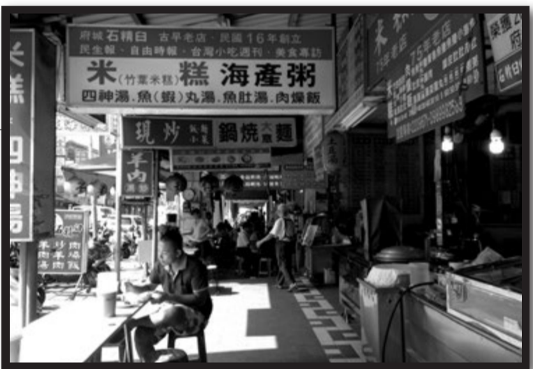
気楽に台湾料理を楽しむなら市場や屋台がオススメ! 目に飛び込んでくる大量の漢字がどことなくノスタルジックな世界へ誘ってくれます。かわいいボーイとも出会えちゃうかも?!

の人は見かけず、ほっとさせてくれます。 あと、 高雄からバスで行ける台湾最南端の「墾丁」も南国リゾートとしてお奨めです。 北→南、台湾ゲイ旅行の新スポット 台南や高雄の人は、格好をつけるのに不慣れで、人との距離感をとることもあまり上手くありません。 北部の人との付き合いに慣れた日本人には、このあたりに違いを感じるのではないかと思います。冬でもほとんど雨が降らない高雄では、毎日のように陽光が降り注ぐので、通りで日に焼けた素朴で爽やかな男性の姿を目にすると、思わずウキウキした気分になってしまいます。 南部は、私のような訪ねることも少ない台北人には、新鮮さに溢れた場所です。