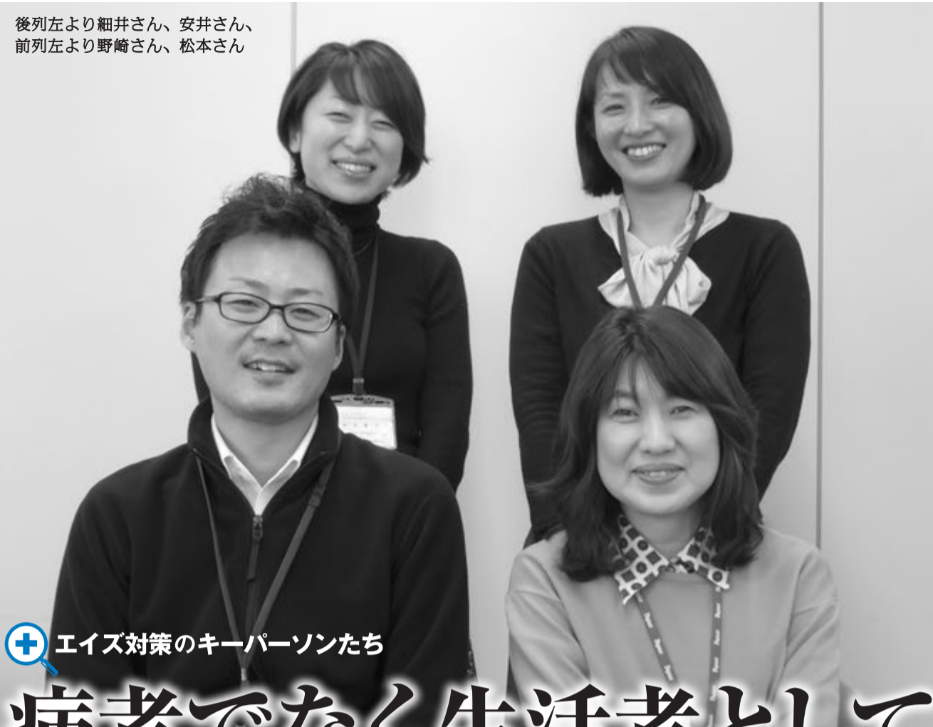
エイズ対策のキーパーソンたち