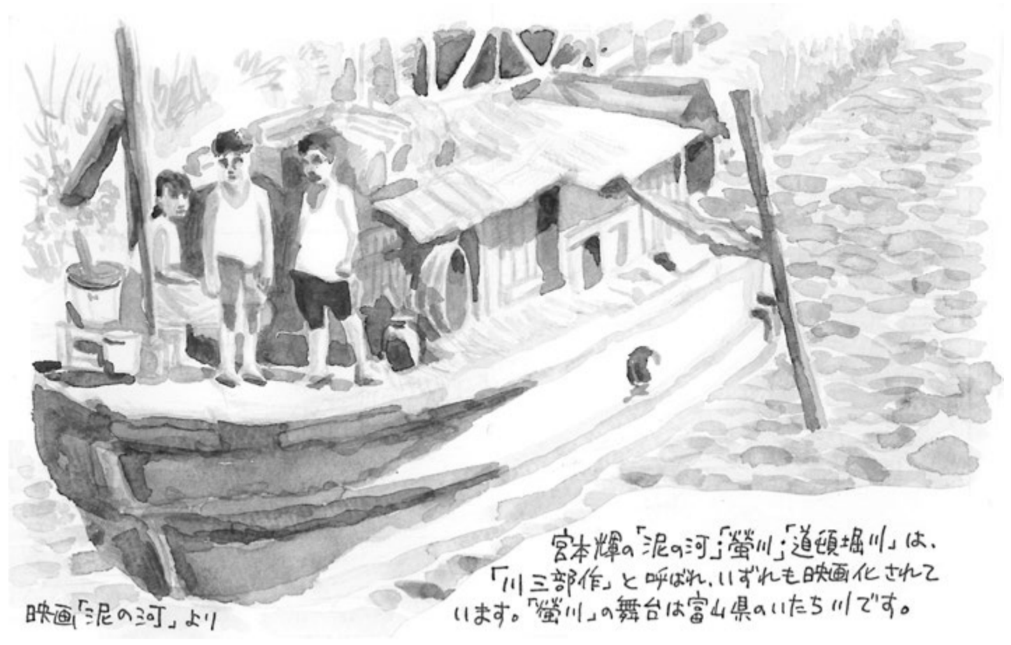
宮本輝の「泥の河」「螢川」「道頓堀川」は、「川三部作」と呼ばれ、いずれも映画化されています。「螢川」の舞台は富山県のとちぎ川です。

2年半を過ごした後、大阪に店を構えて3年目になる。日本で脱毛が広まった当初はコンプレックスを解消するためのもだったが、時代の流れと共にオシャレ、キレイになるための脱毛へと変化した事もあり、月に1回、散髪に行くような感覚で気軽に予約を入れる方が多いそう。とはいえ施術自体はとてもデリケートな事なので、どれだけリラックスして頂けるかが大きな課題。単なる施術だけでなく、サロンの友達や親にも打ち明けられない事を話して下さるお客様も多いうえ、明るく朗らかな口調で語る中村さんに「癒し」を求めて通うお客様が多いのも納得できる。脱毛に興味がある方は是非ともアクセスしてみて下さい!