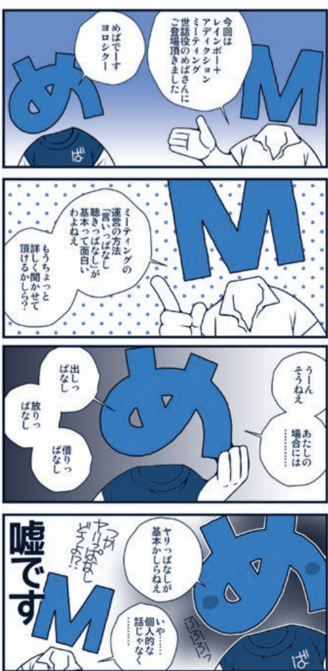
by Kazuhide Ichikawa

M：最後にスバリ訊きます。めばさんにとってアディクション(依存)とは？ めば：自分のなかに自分でコントロールできない悩み、親子関係とか、セクシュアリティのこ