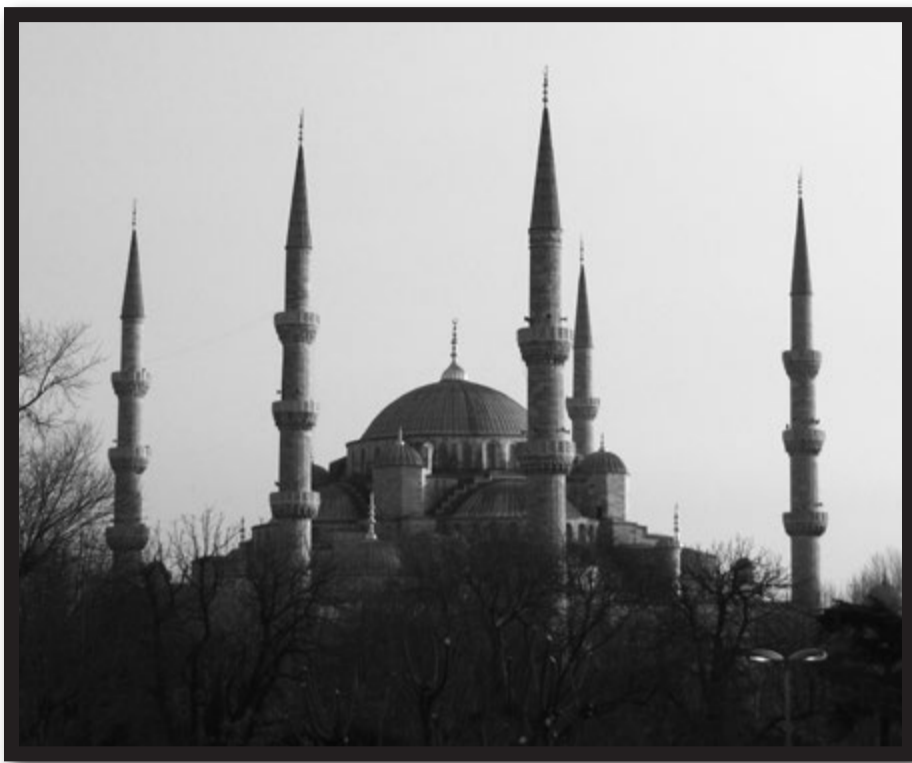
スルタンアフメット・ジャーミー、通称ブルーモスク。現役のモスクなので入場料なし。向かいのアイ・ソフィアは博物館なので結構取られます。

空港からタクシーでホテルに向かう途中、左手に海が見えたので「あつボスフォラス海峡だー!」と叫ぶと、タクシーのおっちゃん「ちやう、これはマルマラ海。海峡はあつちやー」と左手前方を指さす。確かに陸地が両側からベンと迫って来ていて、左側(ヨーロッパ側)には巨大なモスクの影が。タクシーはそのモスクをまわってまっしぐら…。