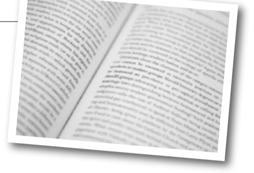
文●そよ風さん 2004年デビュー。京都神宮丸太町のCLUB METROで毎月最終金曜日開催のDiamonds are foreverに出演。

少し前にツイッターで見た4コマ漫画で、映画好きな男性に、女性が「おすすめの映画教えてよ」と言ったら、男性が意気揚々と好きな映画の話を出す。すると、女性が「お前の好きな映画の話じゃなくて、私におすすめの映画の話をしてよ。」このコラムがちゃんと需要に応えた内容なのか、ドキドキしながらの本の紹介です。