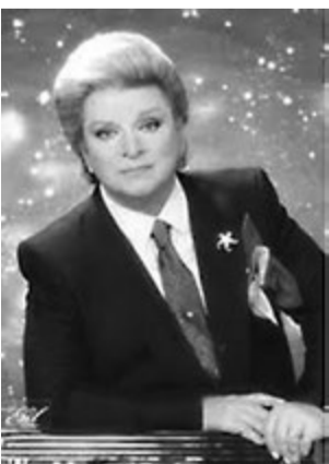
福島にあるトルコのニイチツモセキ・ミュレン、ナンバーワン!!!と叫んでました。いずれにしても彼の存在がLGBTの可視性を飛躍的に高めたのは間違いない。

ウスの大半は「歌手の登壇前」の風情。じつくり探せばきっと堂山みたいな一角もあるはず。その友人によれば、イスタンブールのゲイ事情は日本に似てらしい。彼はずっとトルコ人のパートナーと広いアパートに同居していて、「彼の家族もよく泊まりに来るから、二人の関係は公然の秘密なんだけど、面と向かってカミングアウトするかどうかという事態になるか予測がつかないのでそこは気を付けてるんだ。」