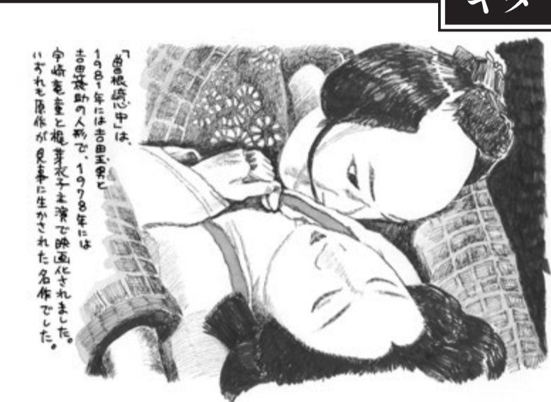
南界堂通信 春号 第6回 (2014年2月14日発行)

の生の中には、これまでこの世界を生きたすべての人々の生が吸い込まれ宿っている。私はひたすら吸い込み、そして吐き出し、忘れる。他には何もしていない。ただひたすら吸い込み、吐き出し、忘れる。人の生は端的には無意味だが、以上の理由により普遍的な価値を持つ。私たちの中にはおびただしい他者の生、いわば人類史そのものがある。優れた文学や芸術にはその普遍性がある。音楽も例外ではない。私はそれが「文化」だと思ふ。そして私が南界堂通信でやりたかったことはおそろしく、そういうことだったのだ。わたしの中にあり、あなたの中にもあり、私たちが生きるこの