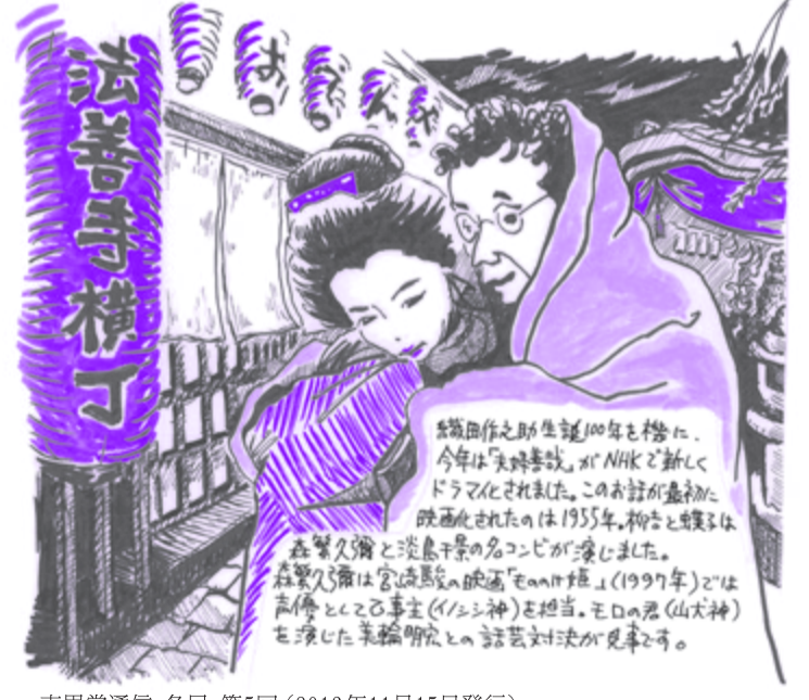
南界堂通信 冬号 第5回 (2013年11月15日発行)