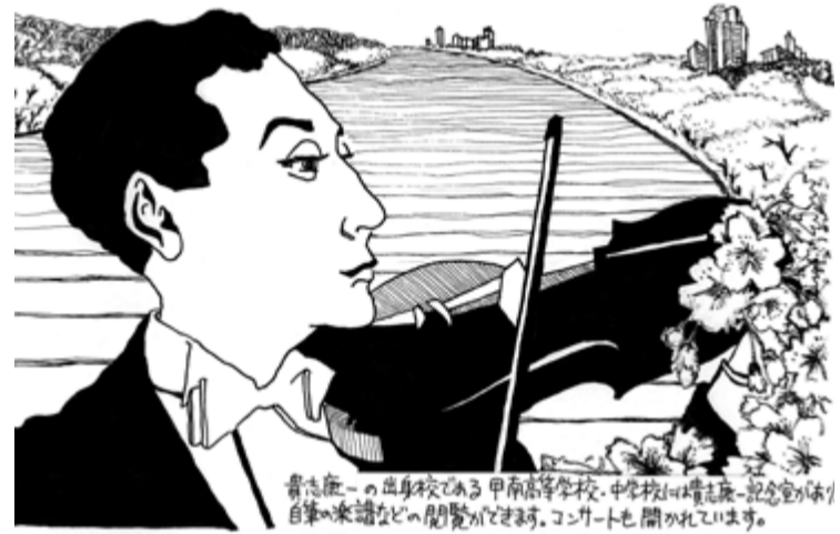
南界堂通信 春号 第10回 (2015年2月27日発行)