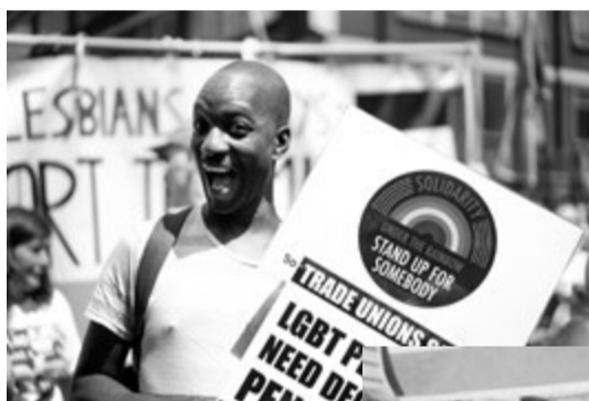
2015年のロンドンプライドパレードのLGSMブロックには、映画『パレードへようこそ』のキャストらも参加。LGSMの横断幕にオリジナルメンバーとキャストたちが一同に介した。その姿を撮って涙を流す人も多数。右の写真は、後に国会議員になったシアン・ジェイムズを演じたジェシカ・ガニング。そのシアンもパレードに参加。