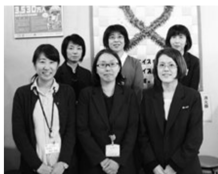
泉佐野保健所の皆さん。チームワークもバッチリ!

和歌山と大阪の県境に位置するので生活圏が和歌山方面に及ぶ方も多く、和歌山から検査を受けに来る方ももちろん病気の診察に和歌山の病院を受診される方もいるそう。