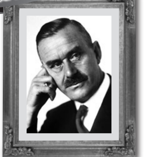
トーマス・マン (作家 / 1875-1955)

前回では、『ヴェニスに死す』発表後、妻・カーチャの結核が判明したところで終わりましたが、今回はそれを契機に生まれたマンの名作『魔の山』と同性愛の問題についてお伝えします。