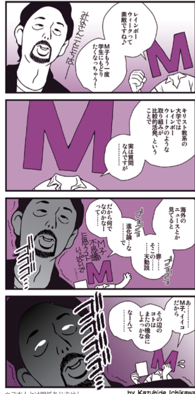
※ご本人とは関係ありません。

研究室が並ぶ廊下を歩いていると、教員の名札のところにレインボーステッカーが貼ってある研究室がた〜さんあって、「なんて風通しのよい大学かしら!」。大学ランキングの項目に「LGBTが学びやすい大学」というのがあればよいのに、って思いました!