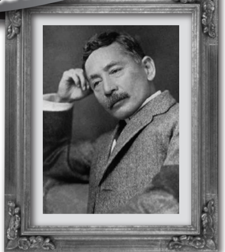
夏目漱石 (小説家、評論家、 英文学者/1867～1916)