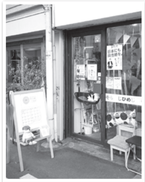
〒670-0922 兵庫県姫路市二階町3 ☎ 050-3746-4571 午前11:00~午後9:00 (日曜・祝日 午前11:00~午後7:00) 定休日:水曜日 https://soranjihimeji.wordpress.com/aboutus/

「亡くなった場合に喪主を務める事が出来るのか?」「生命保険を受け取る事はできるのか?」 いくらパートナーシップ制度が導入されているとはいえ、まだまだ乗り越えないといけない壁はたくさんあるように思います。また現実問題として、「最低限これは認め