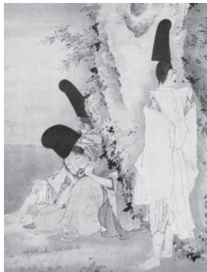
曾我蕭白が描いた、後醍醐天皇が討幕に失敗し笠置山に逃げたときの情景

エイズ対策についてベルギーと日本の違う点は、ベルギーはイギリスと同じくホームドクター制の国なので、例えばゲイ男性がHIVの検査をしようと思ったら公立病院で検査を受けます。陽性であれば自分が所属するホームドクターのところへ検査結果を持っていき、