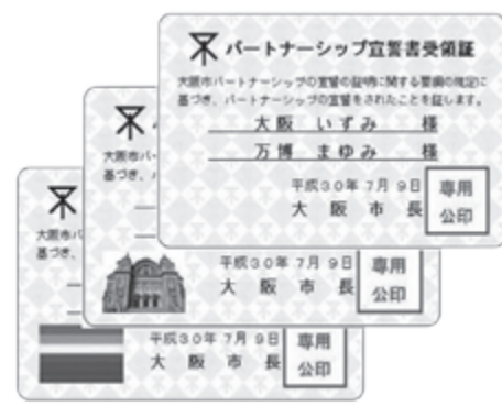
同性カップルに配布するカード型の宣誓書受領証。複数のデザインから選ぶことができる

無が関係しているのかな。 B …この制度についてパートナーと話し合おうという人は多いよね。利用する数が増えている。法律も必要だろし、その足元としての意味はある。道ができて、広がっていく感じ。 C …二人の話を聞いて、うちもしたくなった。実は、最初に市長が受領書を渡すのをTVで見て、相方はクローゼットなので嫌がった。でも、プライベートは守られるようにだし、説得する(笑)