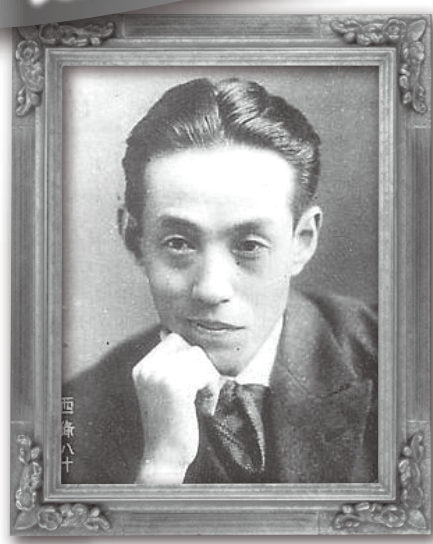
西條 八十 (詩人/1892-1970)