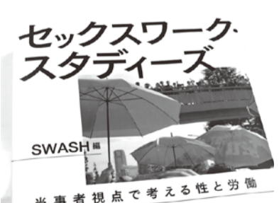
2018年「セックスワーク・スタディーズ 当事者視点で考える性と労働」(SWASH編)を日本評論社から刊行。

間であっていいことをやる。そういう人たちの活動をうまくコーディネートできればよい、と考えるようになりました。そうしたスタンズで、一九九九年に立ち上がったSWASHという団体に関わるようになり、「セックスワーカーの現場にとって利益になること」をミッションに掲げて活動を続けてきました。 M…MASH大阪が立ち上がったのが一九九八年ですか、ほぼ同じ時期ですね。 要 …ええ、MASH大阪と同じように私たちも研究者と協働体制を組み、セックスワーカー向けの性感染症予防の啓発資料を開発し、配布したり、セミナー研修や相談員研修を行ったり、調査に協力したり、当事者向けイベントを開催したりしてきました。これまで 四人の研究者を通じて厚労省の研究班に参加してきましたし、厚労省の研究費だけでなく、フェミニズム基金、リー