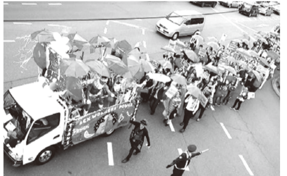
2019年東京レインボープライドで、セックスワーカーのフロートとしては初の出演

… 要 …研究者と協働しつつ、当事者の目線です、当事者の性的健康を向上させようという目標まで同じだと思のうですが、違う点があったとあります。ひとつは、ゲイであることと、その一生涯ついてまわるアイデンティティでもあるから、コミュニティらしきものがつくられやすいのに対し、セックスワーカーを一生やっていこうって考える人はほとんどいない。仕事に貼られた名前にすぎず、コミュニティが形成されにくい。もうひとつは、社会の中にセックスワーカーを差別化する傾向が強いある、ということ。差別観をあげて言葉にあらわすと「差別されるとわかっていてその仕事選んだんでしょ?」とか「女を売るなんて…」ということになるかな。