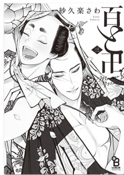
「百と卅」(紗久楽さわ)

た後のセックスが、発情期が終わってからのものとして描かれているあたりには BLの醍醐味がある。 江戸時代を舞台にした『百と卅』(紗久楽さわ)は、商業BLでは初となる月代姿のキャラクターを描く。着物の柄や長屋の様子など、 この時代の風俗史に造詣の深い作者のこだわりが細部にわたって描かれている。 元陰間(江戸時代の男娼)であった主人公の描写も丁寧で、「今も昔も困われ者」「可愛がられるだけで安穩として」といった抑鬱を乗