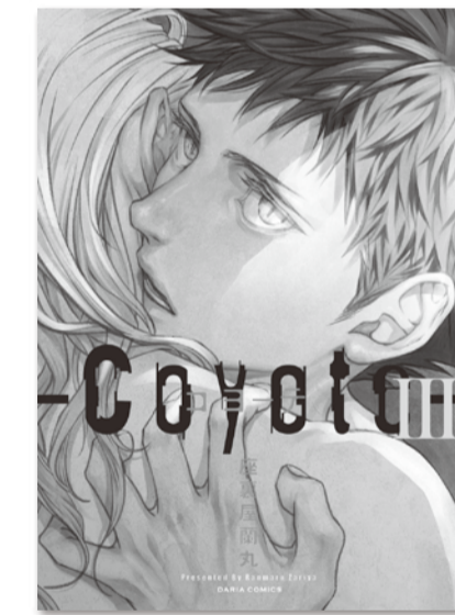
「コヨーテ」(座裏屋蘭丸)

あげてみよう。人間と人狼の異種間恋愛を描く『コヨーテ』(座裏屋蘭丸)は、自分の子どもを人狼に殺されたマフィアのボスが、人狼の絶滅を目論むのだが、その後継者である主人公は人狼に恋してしまうという物語だ。長い対立の関係と、置かれた立場の差異(マジョリティとマイノリティ)が、異種であること以上に二人の間の障壁となる。人狼にある発情期という設定によって、恋愛関係になる前のセックスが描かれるのだが、 二人が心を通わせ