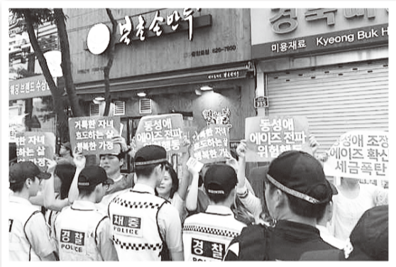
テグのパレードでの抗議活動(2015年)

韓国のLGBT事情を、日本の国立大学で人文地理学を専攻する留学生のジンさんに語っていただきました。