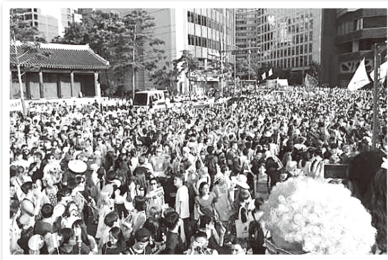
ソウルパレード風景(2015年)

文 ● 堀あきこ ジェンダー・セクシュアリティやメディア文化を研究する大学非常勤講師。小学生の時に『少年愛』作品と出会い、BLとは長い付き合いに。マンガをメインに研究してきましたが、現在はタイBLドラマにハマっています。『BLの教科書』はdistalに書いていただいているので、ぜひ手にとってみてください。