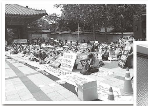
ソウルのパレードでの抗議活動(2015年)