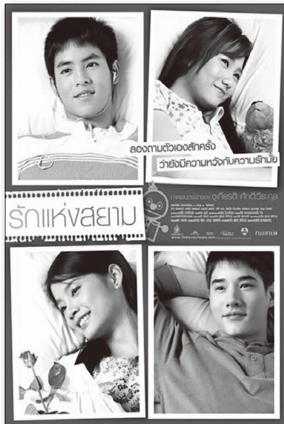
『ミウの歌～Love of Siam～』（2007）