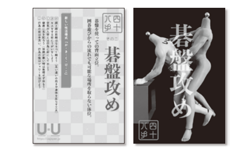
新しい性活様式「か・き・く・け・こ」