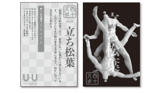
新しい性活様式「た・ち・つ・て・と」

文●げいまきまき コミュニティセンターdista スタッフ。元セックスワーカー。写真は二〇一八年国際エイズ会議会場で。コンドーム所持がセックスワーカー逮捕の理由になる国のワーカーによる抗議の意味を含めたパフォーマンスの中で。