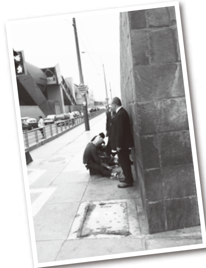
靴磨きは山間部出身の先住民の人が多い。階層化社会を象徴する風景