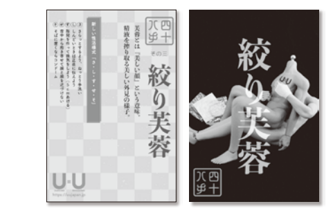
新しい性活様式「さ・し・す・せ・そ」