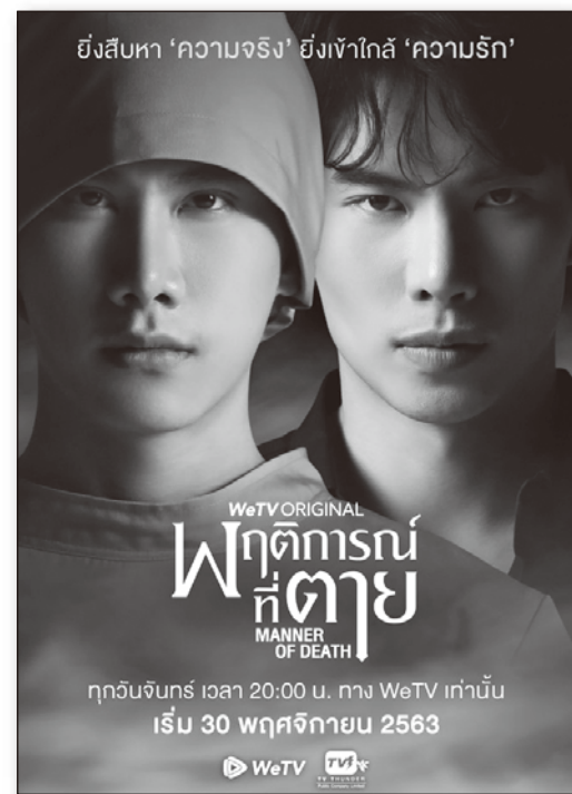
『マナー・オブ・デス』（2021）

ドラマが『マナー・オブ・デス』である。タイ北部チェンマイの郊外、霧に覆われた田舎町で起こるクライムサスペンスで、原作は現役医師によって書かれたものだ。BLドラマ制作の依頼を何度か断ってきた監督がメガフォンをとったのは、「学校が舞台のラブコメディ」というタイBLドラマの枠組みに収まらない原作だったからだといえる。 ネットドラマは手軽に楽しめるものだ。そうしたメディアで、ゲイリーションシップ