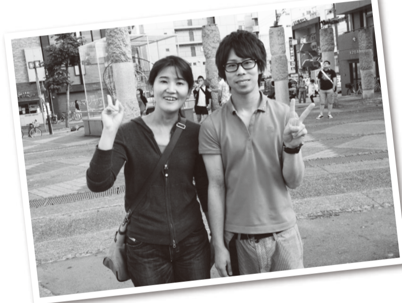
8年前、当時の検査会を手伝っていた看護学部生と

ました。検査会場もNLGR+のイベント会場そばのホテルで行ったり、色々な変遷を経て、地下鉄の栄駅すぐそばの名古屋市の保健センターで行けるようになりました。名古屋市、名古屋医療センター、医療系学生など二〇〇名を超えるボランティア・スタッフが参加してこの検査会を実施されています。参加学生からも検査やセクシュアルマイノリティへの基礎知識を得