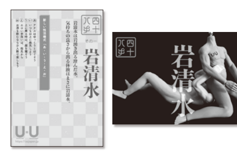
新しい性活様式「あ・い・う・え・お」

SNS等で個人が思うことを発信しやすい時代になった為、それぞれの違いの可視化も進んでいます。コロナのニーズを巡っても違いは肯定や排除に繋がりがやすい一面として炙り出されています。