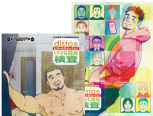
②「distaでピタッとちえっくん」フライヤー