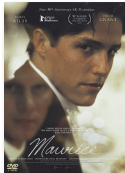
映画『モーリス』(1987年製作)

エドワード・モーガン・フォースターは一八七九年、ロンドンで生まれる。翌年には建築家だった父親が結核で亡くなるが、そこは大英帝国華やかなりし時代、彼が八歳のとき父方の大祖母の遺産を相続し、生涯、お金に困ることとはなかった。ケンブリッジ大学に進み、そこで得た友人・知人たちとともにロンドンで作家活動をはじめめる。九十年に及ぶ長い生涯でフォースターは六つの小説を書いていく。そのうち、最も良く売れたのが『眺めのいい部屋』、評論家に高く評価されたのが『ハワーズ・エンド』と『インドへの道』、そして同性愛に正面から取り組