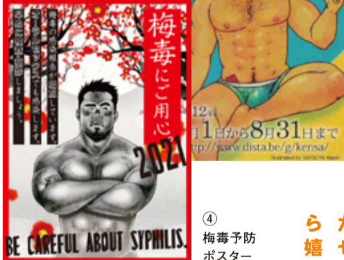
④梅毒予防ポスター