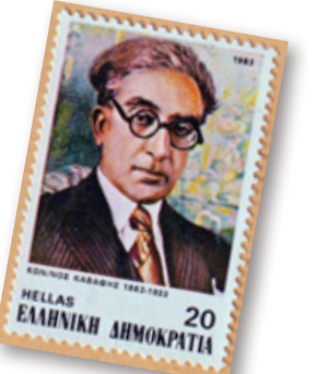
ギリシアを代表する詩人として 切手にもなった

ヘレニズムと現代を自由に行き来する、ホモエロティックな詩想を紡いだ コンスタンディノス・カヴァフィス。彼を世に送り出したフォースターとの出会い。――