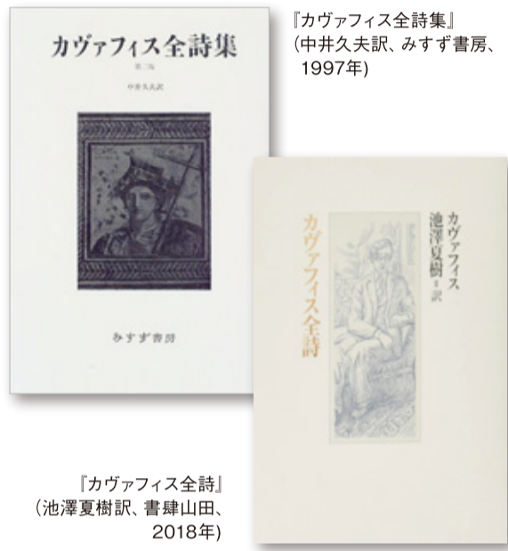
「カヴァフィス全詩集」(中井久夫訳、みすず書房、1997年)

だ。東地中海の地図を見れば一目瞭然、この町はギリシアやトルコの南に位置し、シリアやパレスティナからも至近距離にある。陸路より海路が発達していた時代、地中海各地に植民都市を建設していたギリシア人たちがエジプトの拠点としてアレクサンドリアを一大港湾都市に仕立てていったのは不思議ではない。かのクレオパトラを生んだプトレマイオス朝もギリシア人