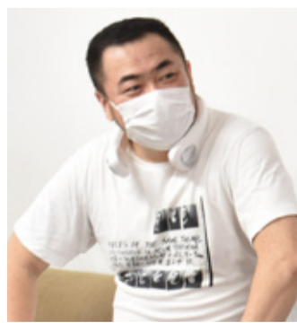
ほかほか屋(ミナミ) TORUさん

ワクチンが急速に普及してきて「ワクチンパスポートで行動緩和」が聞かれます。確認をするのにストレスがある