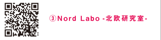
③Nord Labo -北欧研究室-