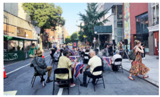
平日の夕方。地区が道を閉鎖して小さなコンサートを無料で開催。

時代でした。占拠運動には参加しなかったのですが、自分の生活を維持するのに精一杯、果たせませんでした。英語での会話、身の安全、人種差別に苦しみながら学校に通い、インターンシップ先を訪れる。ハードな日々でしたがゲイバーにはしっかり通いました（笑）。チェルシー地区にあった大バコ（ヘス・ブラッシュ）をはじめ、イーストビレッジ地区のバーや、ブロードウェイの西側にあるヘルズキッチン地区のバーにはよく通いました。イーストビレッジには流行を気にしない人たちが多かったのが好きでした。ワシントンハイツ地区にはドミニカ系のお店があったし、クイーンズにはメキシコ系、アジア系のお店がたくさんありました。バーで何するかって？ お酒を呑んだり、踊ったり、プールバーでビリヤードをしたり、もちろんハッテンも（笑）。