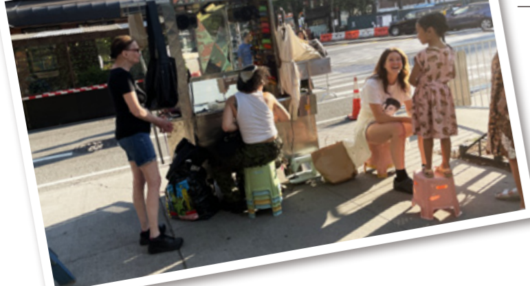
コロナ禍で登場したお直し屋さん。

実は今年の夏、ニューヨークを再訪したのですが、イーストビレッジのお店はコロナの影響でどこもテラス席を設けるようになっていて、なんだか風通しのいい、さわやかな雰囲気に変貌。独特の味わいを持つ場末感が薄まってしまい、僕的には残念！それはさておき、 イシーンの魅力は、上に述べ