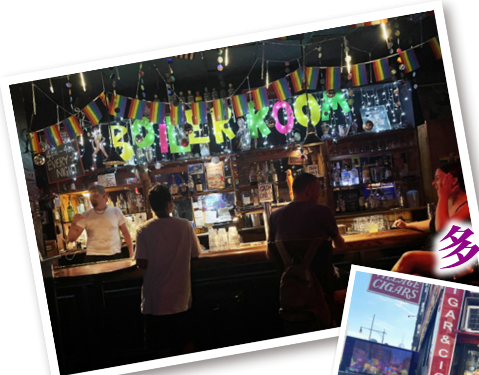
イーストビレッジにあるゲイバー「Boiler Room」。