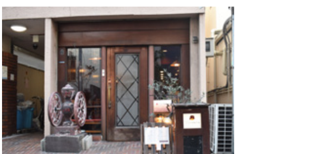
●ニューMASA 〒530-0015 大阪市北区中崎西1-1-16 TEL:06-6373-3445 Instagram:@new_masa.20200404

「もともと譲り店だったし、十年近くやれたし、そろそろ次世代に譲り渡そう」。 M …そうして、ホントに別の方に譲った? マ …はい、譲り店の伝統は守ったわけ(笑)。そして旅に出た。沖縄の友達の店でボランティアで働かせてもらった。それから職探しして、会社で就職。でもねえ、一度自営業を経験すると、サラリーマンは辛いよ。それにお店を譲った方が「そろそろやめたい」って言ってきたから… M …あっさり返り咲いた! マ …ええ、出戻りました(笑)。二〇二〇年四月のことです。でもね、前やってたときの経験を活かして、店のコンセプトを洗い直したんです。まず、営業形態を変えました。平日と土日で違ったりするので、詳しいことはインスタグラムを見てほしいのですが、お昼の時間はカレー屋さん、昼過ぎから夕方までは昭和喫茶、夜は別の人がやるわー。