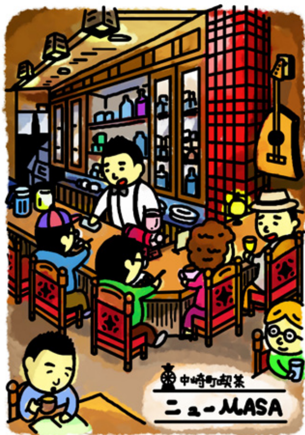
イラスト: すんずん (@kotaroo123)

M …料理学校に通っていたんですか? マ …そうですね。当時胃腸炎を患ってて、二十キロも痩せたんです。ところが、茶屋町ロフトの前に当時あった玄米食堂で玄米食べたら調子がよくなった。それで友達に玄米食系の料理教室を教えるもらって通ってたんです。 M …で、先代ママの提案には何と? マ …二つ返事で引き受けました(笑)。実は私、姫路の出身で、香川県の大学で英米文学を専攻(笑)、大阪のレコード会社に就職し、舞台照明の仕事をするうちに、新地の高級クラブでニューハーフ・ショウの演出を手掛けるようになった。これが本業になったけれど、夜の仕事なので、「お昼の喫茶店だったらやれるやん!」となったわけ。