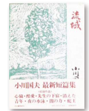
『流域』(集英社文庫・1978年)