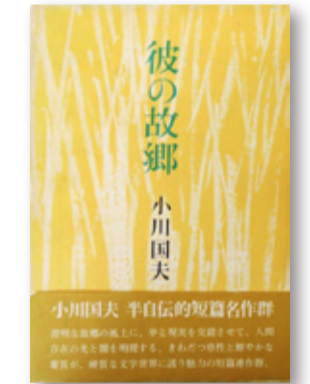
『彼の故郷』(講談社文庫・1977年)