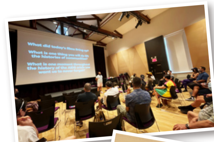
Visual AIDSが13丁目にあるLGBTQセンターで行った上映イベント。