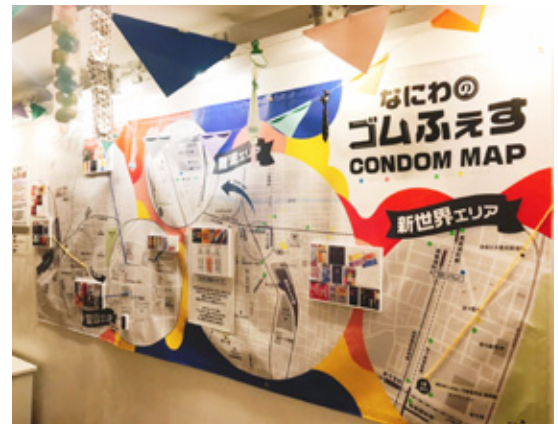
ゲイタウンMAPにコンドーム情報

distaでは2022年11月16日から12月25日まで『なにわのゴムふえす』と題しコンドームの展示会を開催いたしました。大阪のゲイタウン近辺でコンドームがどこで手に入るか、どんなコンドームがあるのかゲイタウンMAPを使い展示しました。またさまざまな種類のコンドームを実際に手にとり触ることのできるようなコーナーも設け、知らないコンドームと出会えるよう工夫しました。