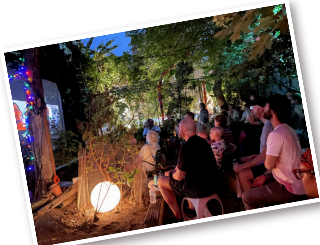
AIDSアクティビストやアーティストが野外で行った上映とトークのイベントを訪問。