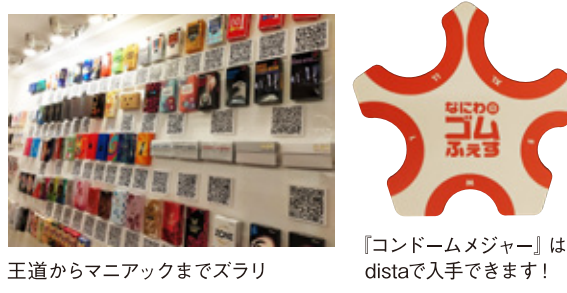
【コンドームメジャー】はdistaで入手できます! 王道からマニアックまでズラリ

だんだんと街に人が戻ってきているように感じますが、かつての全盛の頃とは少し様子が違うようにも感じます。フェティッシュコンセプトのゲイナイトでは肌布一枚にマスクといった出で立ちがとても印象的でした。クラブの中でマスクをする人、しない