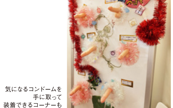
気になるコンドームを手にとって装着できるコーナーも