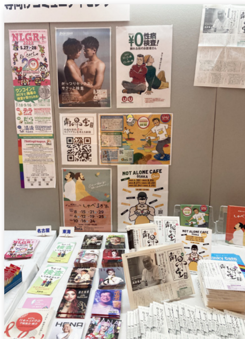
昨年12月に京都で開催された日本エイズ学会の会場で展示されたNGOブースの1コマ。MASH大阪がアウトリーチで配布している資料がたくさん見えています。さて、ここには何がありますか？