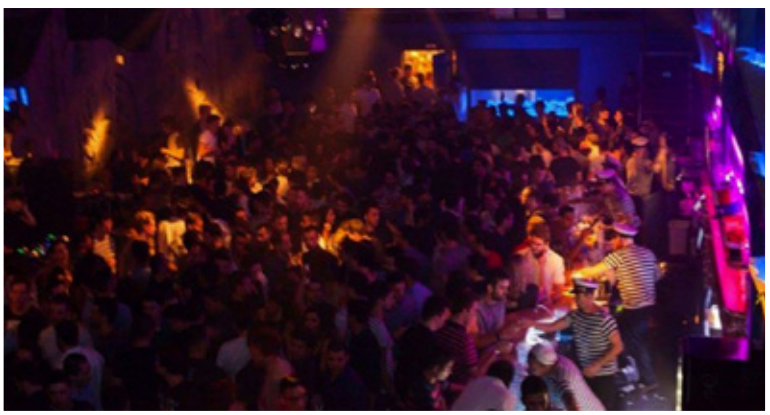
コンソラソン地区の近くにある YACHT CLUB スタッフは船乗りの装束で