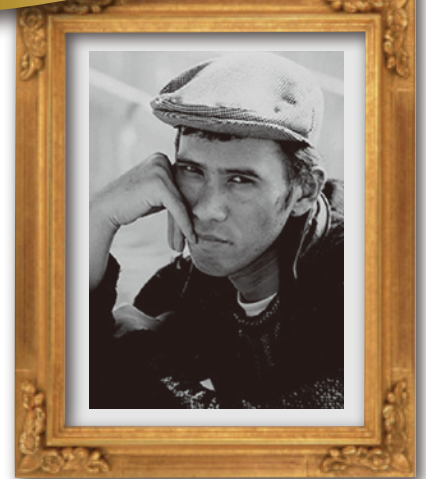
古橋 悌二 (1960-1995)