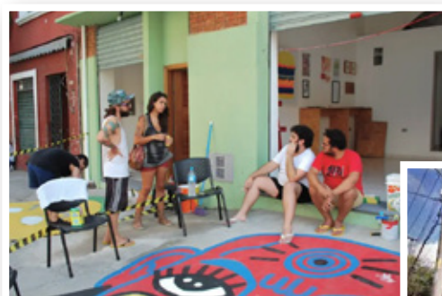
LGBT文化と保護のセンター開設の準備の様子

大学でもさまざまな取り組みがあります。LGBTについて講義や研究会がさかんに行われていて、心理職、医師、弁護士などがLGBTについて学ぶ環境があります。それもあって、サンパウロでは弁護士の働きでトランスジェンダーの人たちが手術の必要なく名前を変更