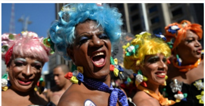
プライドパレードで行進するトランスジェンダーのグループ

最後に、サンパウロのゲイタウンについて。大きなゲイタウンが三つあります。都心で映画館、サウナ、ハッテン場が集中するレブリーリカ地区、同じく都心でカフェ、バーとクラブが多いコンソラソン地区、少し離れた、ダンスクラブが集中するバーハ・フンダ地区の三つです。クラブ・ミュージックは店舗によってジャンル分けされていて、A店では米国やブラジルのポップス、B店ではテクノ、C店ではトライブル・ハウスといった具合に細分化されています。ハッテン系のバーやサウナでは曜日ごとにテーマISM、セクシーマジック、フィストファック、ポルノ男優出演など